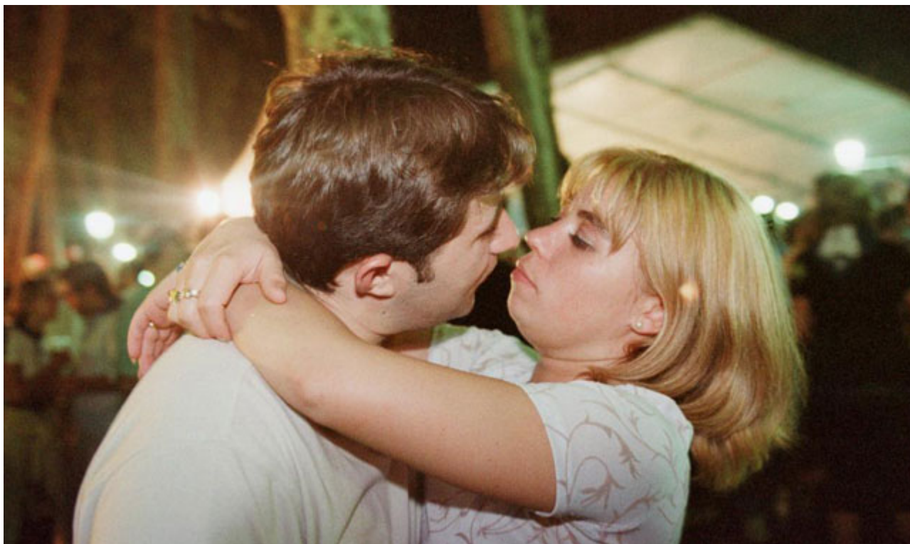
Una pareja besándose. | Listau.